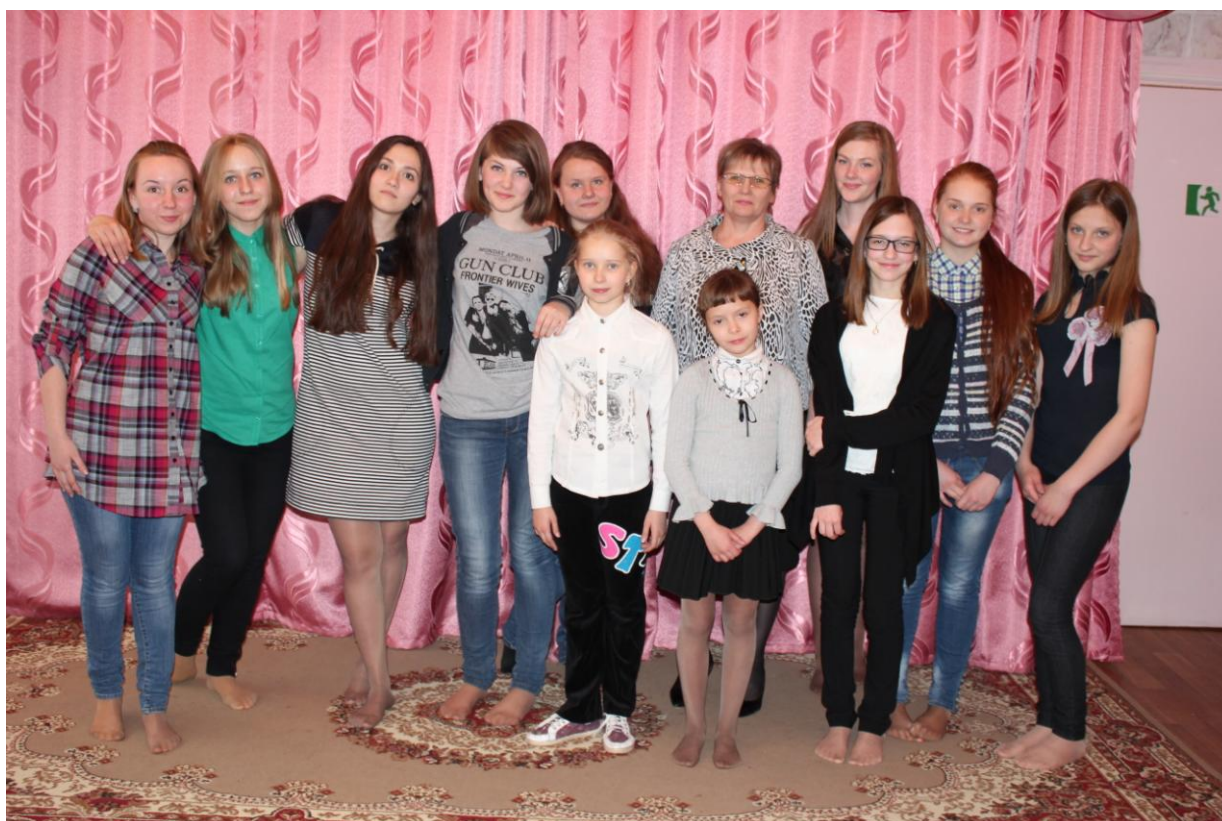
Муниципальное учреждение Губкинского городского округа «Социально-реабилитационный центр для несовершеннолетних»